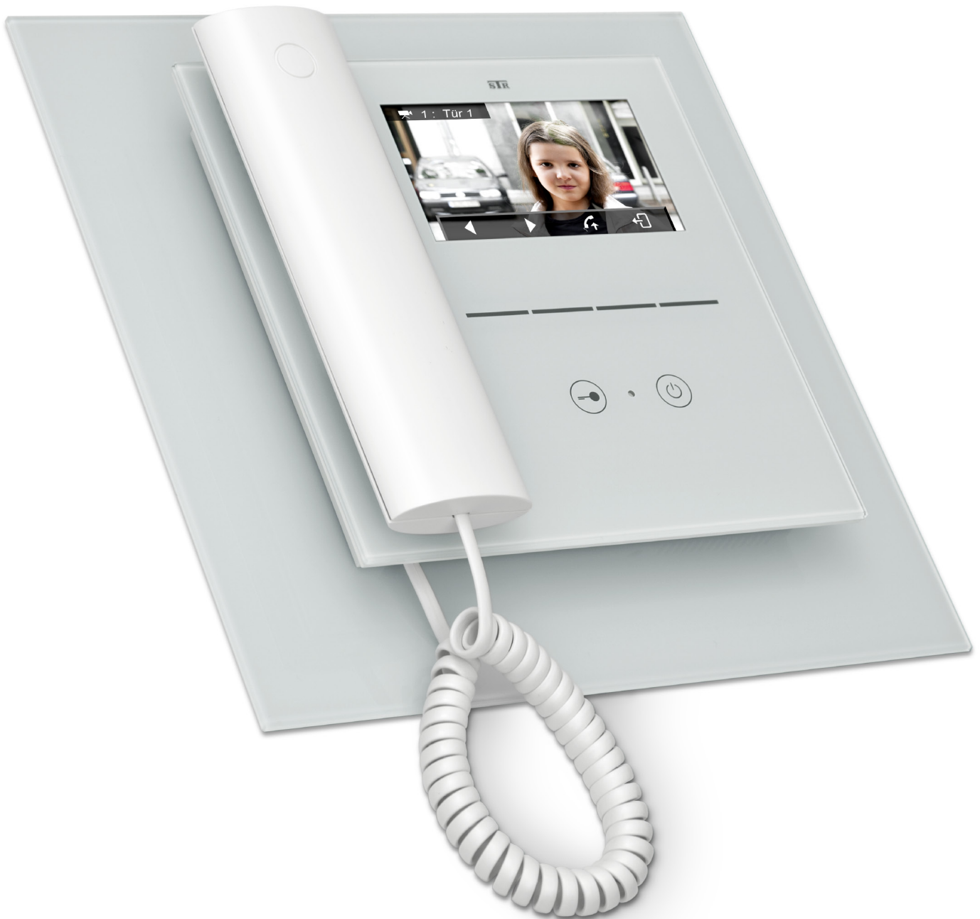
Abdeck-Dekorplatten für Qwikbus Innensprechstellen Serie 40/45