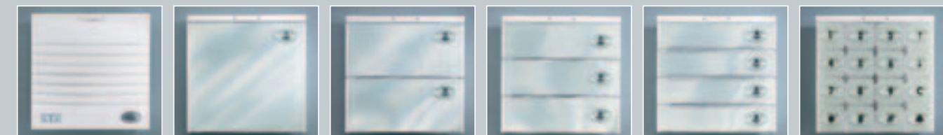
Türsprech-Modul Ruftaster-Modul 1-teilig Ruftaster-Modul 2-teilig Ruftaster-Modul 3-teilig Ruftaster-Modul 4-teilig Code-Modul