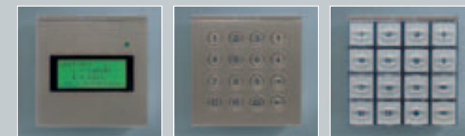
Display-Modul Eingabe-Modul (vandalensicher) Eingabe-Modul