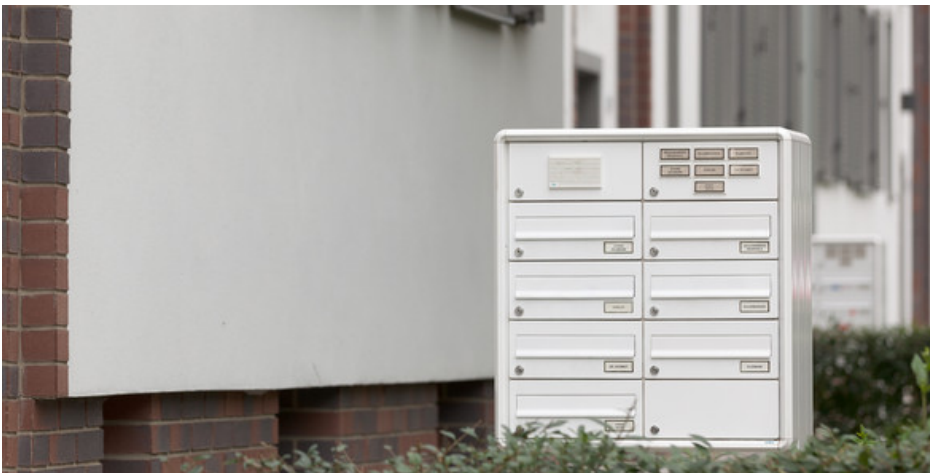
... mit pulverbeschichteter Oberfläche