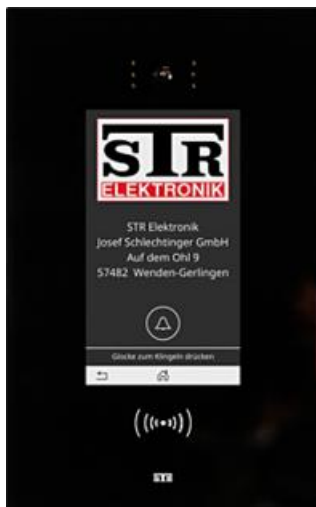
Qwiksmart Touch 7