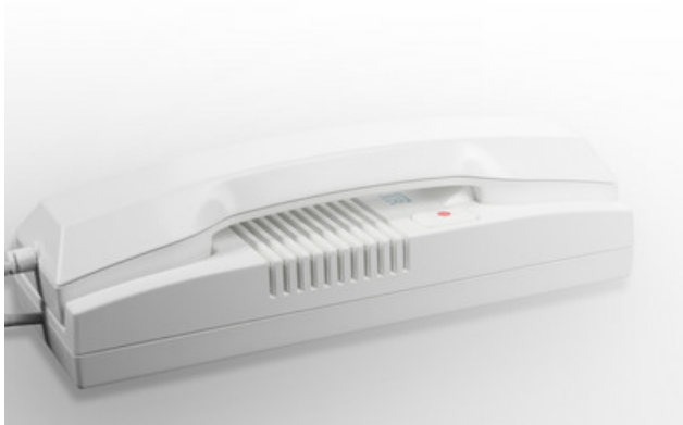
Kompatible Analog- Haustelefone