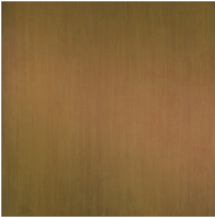
Messing patiniert "Baubronze"