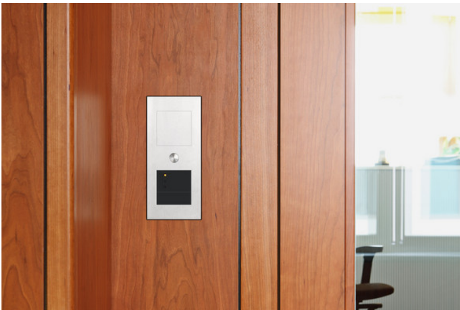
Etagen klingeln und -stationen