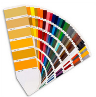
RAL nach Karte